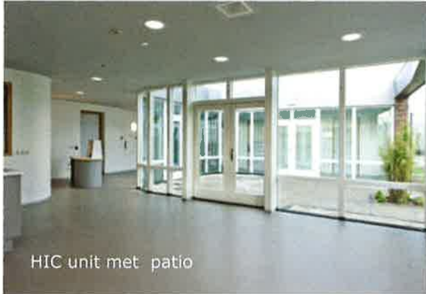
HIC unit met patio