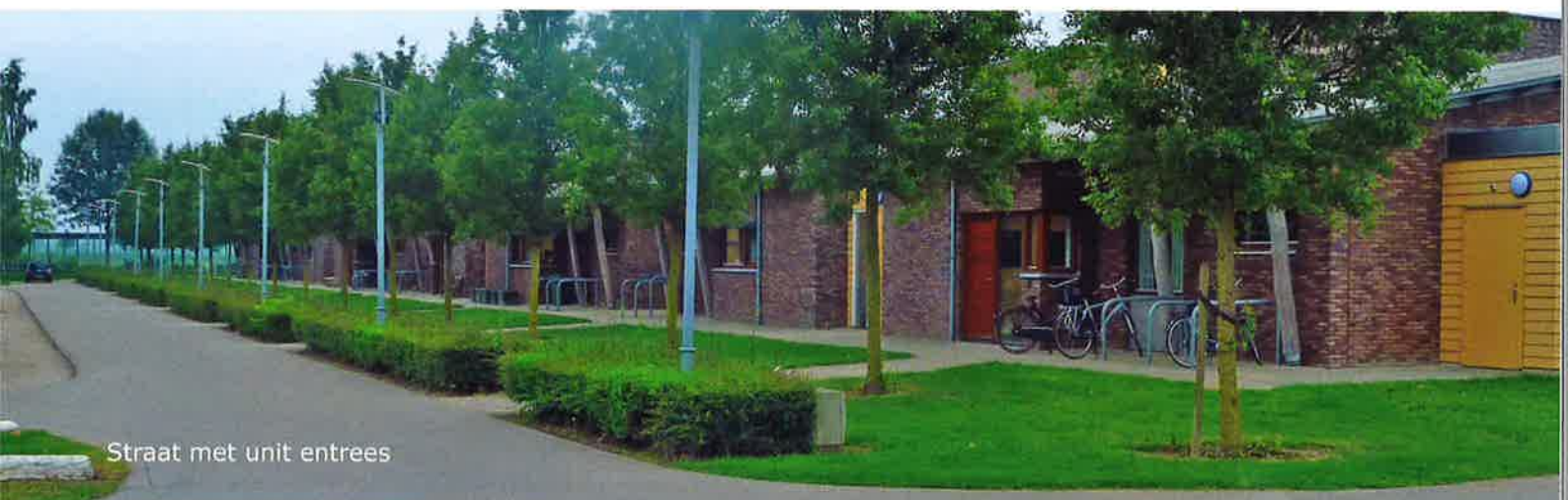
Straat met unit entrees