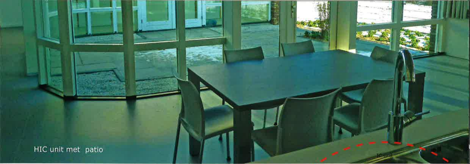
HIC unit met patio

In deze HIC unit zijn een moderne IC-voorziening en een extra beveiligde kamer (EBK) opgenomen waarin in een veilige omgeving specialistische zorg en behandeling kan worden geboden. Deze behandeling kan vervolgens in een leefruimte voor open doorbehandeling worden voortgezet tot in de volwassenheid (18+).