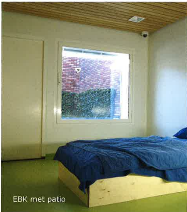
EBK met patio