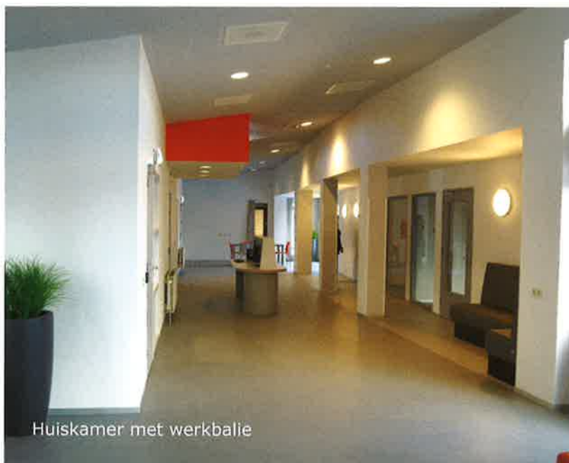
Huiskamer met werkbalie