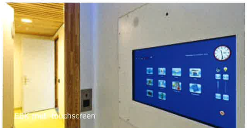
EBK met touchscreen