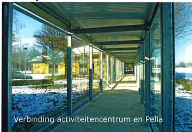
Verbinding activiteitencentrum en Pella