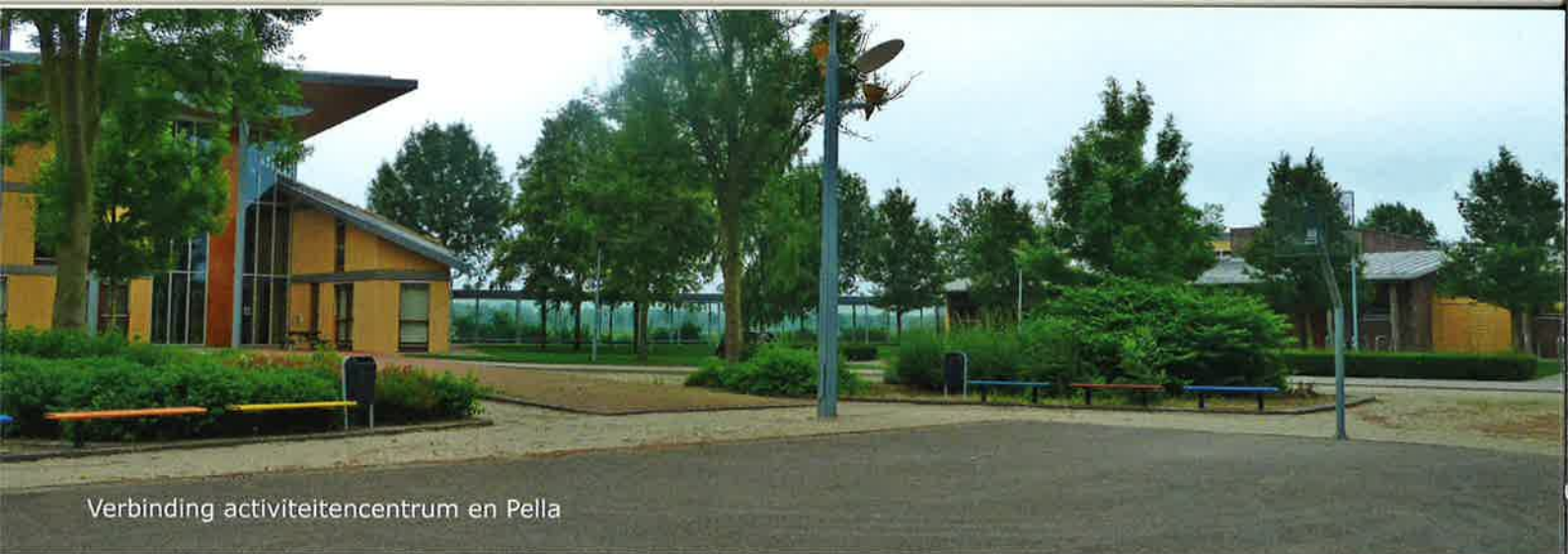
Verbinding activiteitencentrum en Pella